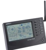
Console de réception